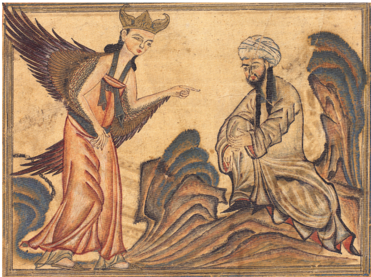
ラシード=アッディーン『集史』写本(1314/15年、おそらくタブリーズ(西北イラン)、エジンバラ大学附属図書館蔵、inv. no. Or. MS. 20, fol. 45b.) (p.17参照)