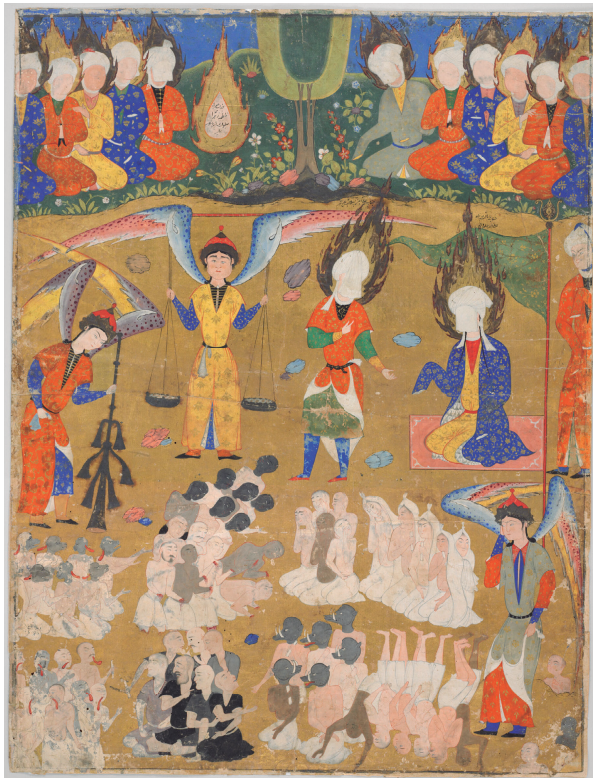
伝ジャアファル=アッサーディク『ファール=ナーメ』写本(1550年頃、おそらくタブリーズ(西北イラン)、ハーヴァード大学附属美術館蔵、inv. no. 1999.302) (p.17参照)